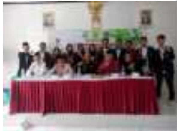
Pembukaan KNM 2023/2024