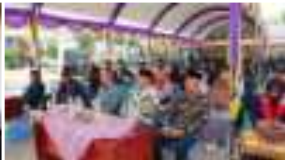
Penutupan KNM 2023/2024