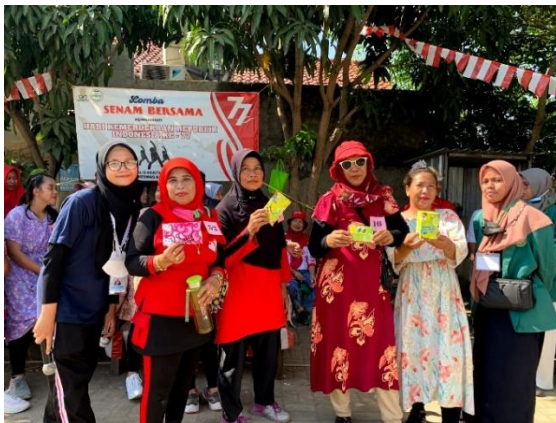
Penyerahan doorprize Lomba Senam Bersama