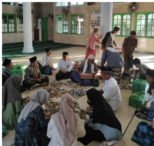
KEGIATAN IDUL ADHA