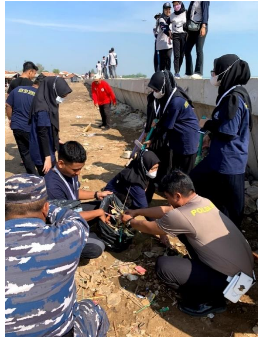
Kerja Bakti Pantai Eretan