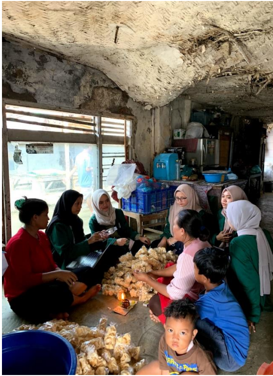
Sosialisasi Digital Marketing Kerupuk Asep dan Sambal Petis Dua Saudara