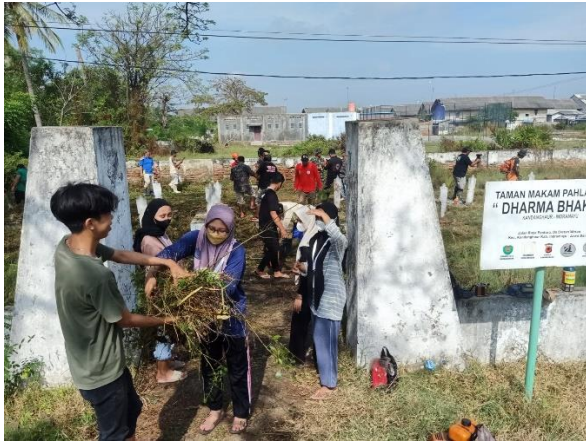
Kerja Bakti Taman Makam Pahlawan