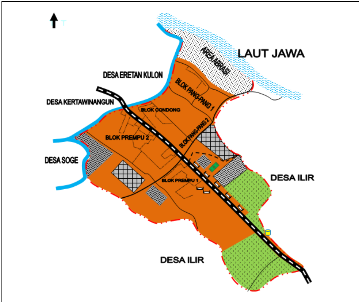
Gambar 1 Peta Administratif Desa Eretan Wetan