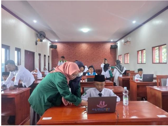
Mendampingi siswa MI mengikuti Lomba KSM (Kompetisi Sains Madrasah)