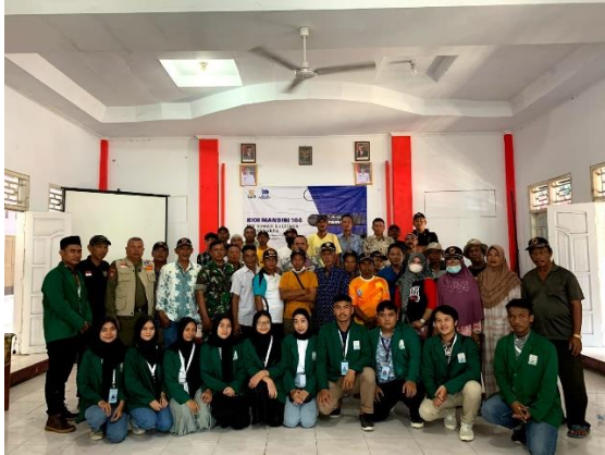
Sosialisasi Program Kerja