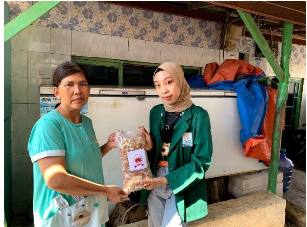
Pemasangan stiker logo merek pada produk UMKM BabyCrab