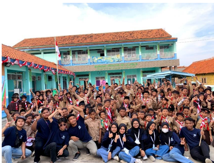
Pembuatan Tempat Sampah dari Botol Ecobrick