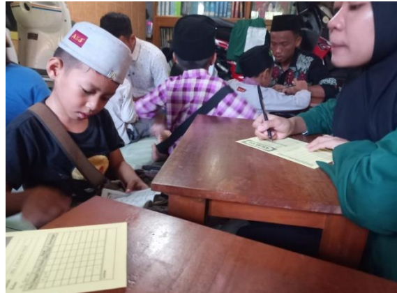
Mengajar di MT Bani Musa