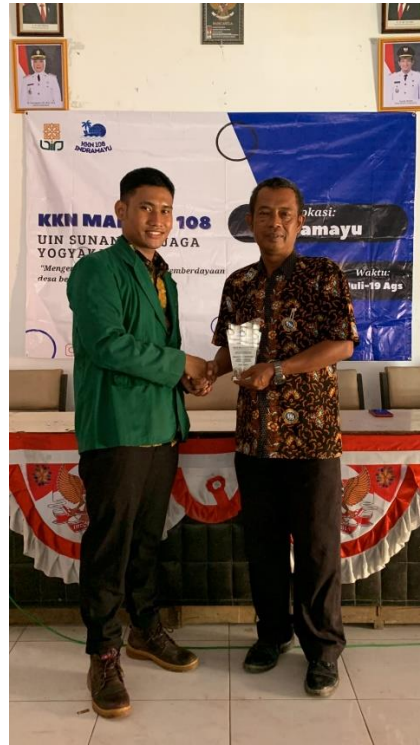
Penyerahan cindramata kepada Kuwu Eretan Wetan