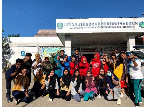
Senam Pagi Rutin bersama Warga