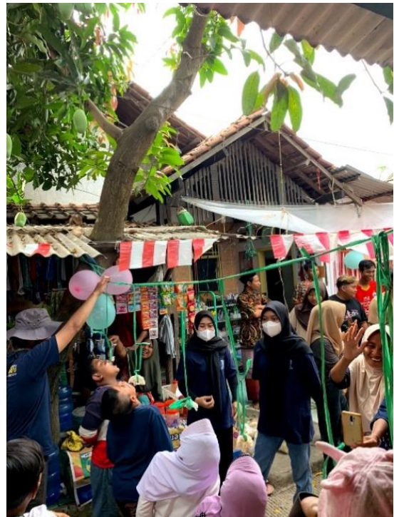
Lomba 17 Agustus