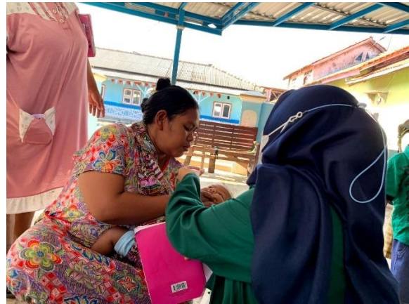
POSYANDU & PROGRAM BIAN